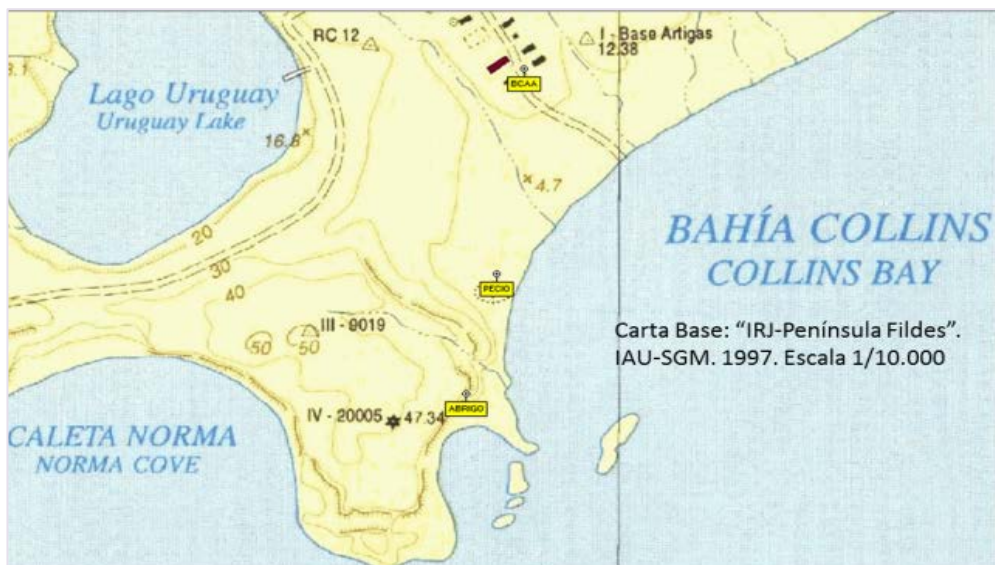
Carta N° 2:

Localización del hallazgo(Punta Suffield)