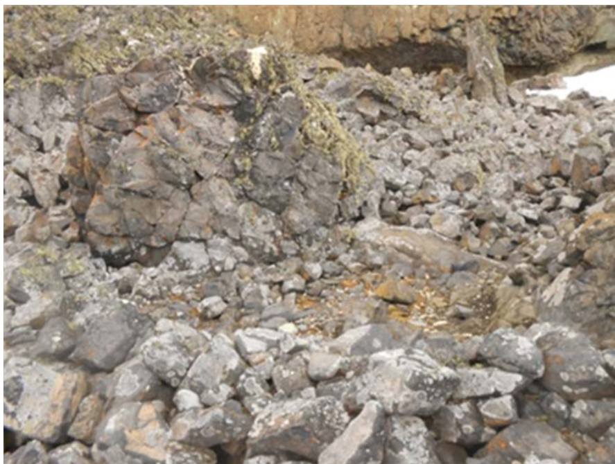
Figura 2: Muro de mampostería en seco, con forma curva, cerrando el espacio entre dos rocas

Inicialmente se podría pensar que estaríamos ante el hallazgo de un recinto focuero o lobero del Siglo XIX, aunque la publicación de Lewis-Smith y Simpson (1987), podría estar refiriéndose al mismo sitio. Sin embargo, si se considera la descripción que allí se hace: “ muro de mampostería en seco que cerraba tres lados de un área... ” (Lewis-Smith y Simpson, 1987), esto no coincide con lo hallado pues el muro de referencia cubre un solo lado, hacia el mar, uniendo dos paredes rocosas, dejando libre lo que sería la entrada hacia tierra firme (Figura 2).