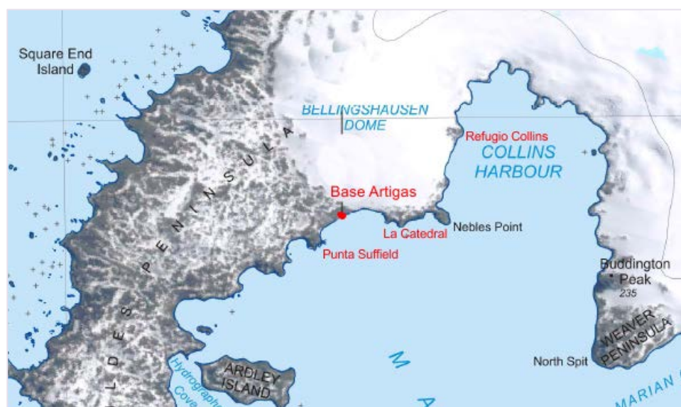
Carta N° 3.

Localización del hallazgo(Punta Suffield)