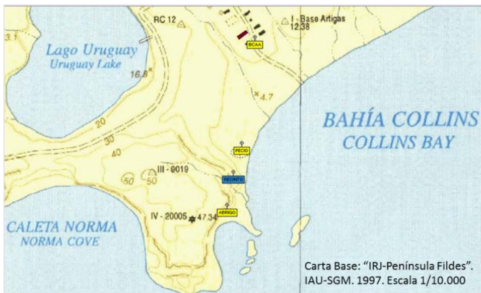
Carta N° 1:

En la publicación Lewis-Smith y Simpson de 1987, no se detallan coordenadas del recinto que se describe, ni tampoco se menciona que hallaran huesos o restos humanos. Hasta el momento no se ha encontrado una publicación que mencione el hallazgo de restos humanos en Punta Suffield, aunque si han sido hallados en otros sitios, por lo que no habría que descartar esa hipótesis.