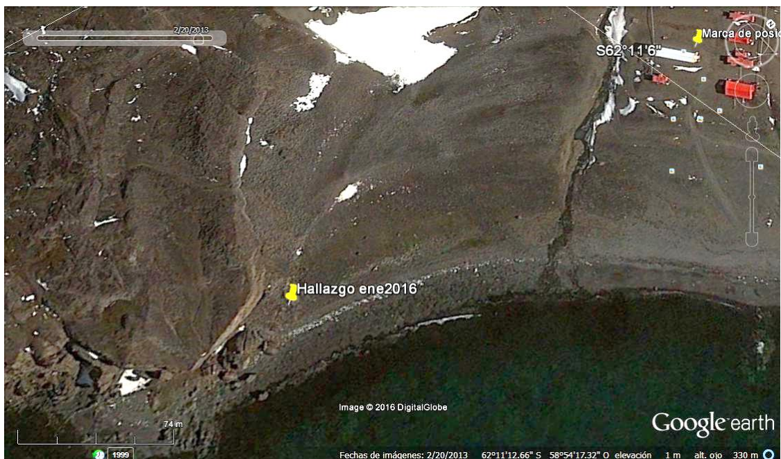
Localización del Hallazgo 62°11'14,85563"S 58°54'17.55809"W