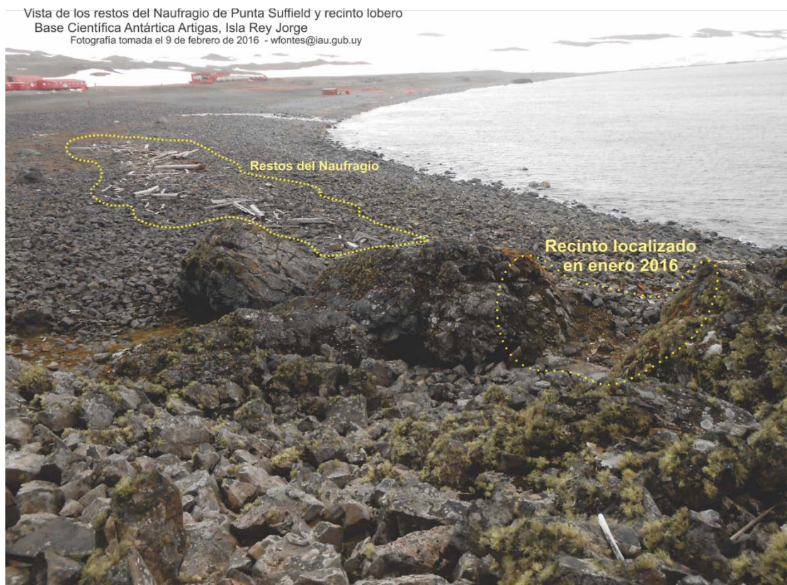
Fotografía panorámica de la zona descrita – (09feb2016)

Continuando con ese recorrido, el martes 19 de enero 2016, al efectuarse el monitoreo de los restos del naufragio, se observó una agrupación de piedras, que conformaban un muro entre dos rocas, de características similares a los recintos de focueros y loberos del Siglo XIX ubicados en otras partes de la Isla Rey Jorge ya reportados y estudiados, por lo que se procedió a realizar una inspección más profunda, comprobándose a partir de ella que se podría tratar de vestigios de una construcción precaria de las mismas características.