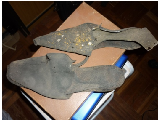
Figura 3: zapatos hallados en la zona del naufragio de Punta Suffield